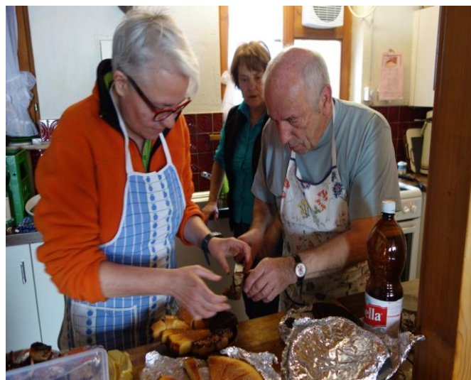
Konzentration am 15. März 2015