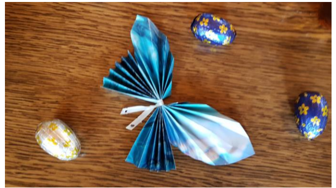
Tischdeko am 08. März 2020

Schwierige Zeiten lassen uns Entschlossenheit und innere Stärke entwickeln. Dalai Lama